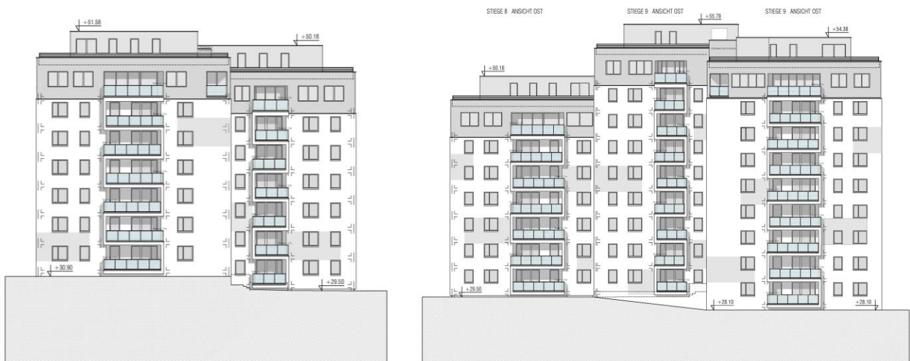
Ansicht Stiege 8: West + Ost

Die Fenster auf Ihrer Stiege werden ab April 2018 vermessen (Naturmaße). Der Einbau der neuen Fenster auf Stiege 8 beginnt ab Mitte Juni 2018 . Sie werden dazu für einen Termin von der Montagefirma kontaktiert .