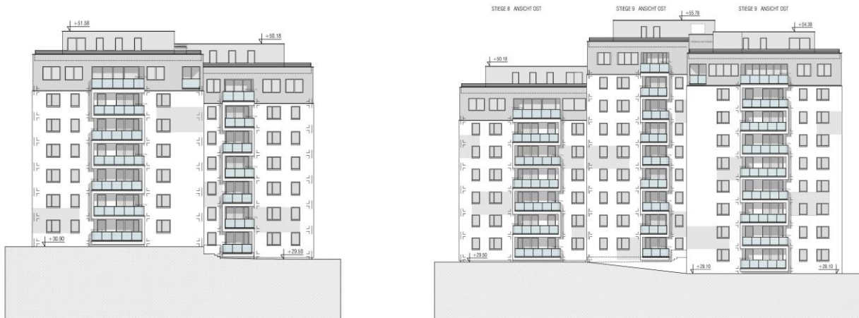
Ansicht Stiege 8: West + Ost

Die Fenster auf Ihrer Stiege werden ab Juli 2018 vermessen (Naturmaße). Der Einbau der neuen Fenster auf Stiege 7 beginnt ab Mitte August 2018 . Sie werden dazu für einen Termin von der Montagefirma kontaktiert .